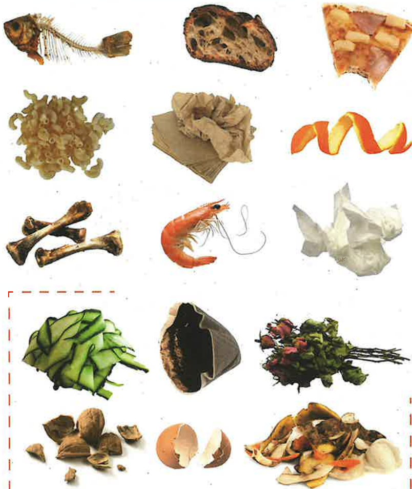
Ces biodéchets peuvent aussi être déposés dans un composteur