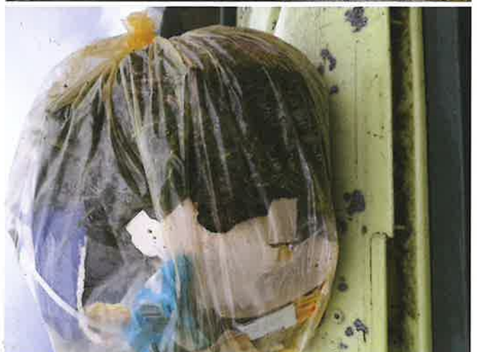
Exemples d'utilisation erronée de sacs